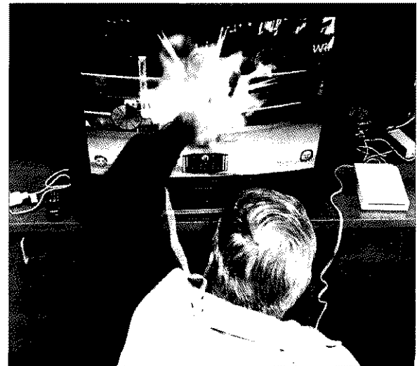
►► Un hombre juega con una consola Wii.

Aunque de momento no se ha topado con casos de wiitis en su práctica de la medicina, el médico apunta la posibilidad de que se trate de un mal «infradiagnosticado». Por eso lanza una alerta a sus colegas. Ya hay juegos virtuales de tenis, golf, boxeo, béisbol y bolos y los médicos, dice, deben estar atentos. ■