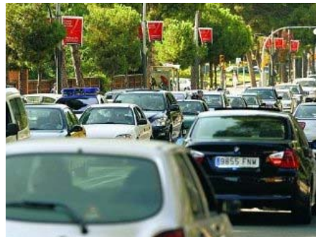
Colas de coches a media tarde de ayer en la zona alta de Barcelona.

D.R.Caruncho/L.Tusell Barcelona | hace 5 horas | 0 comentarios | + 0 - 0 (0 votos)