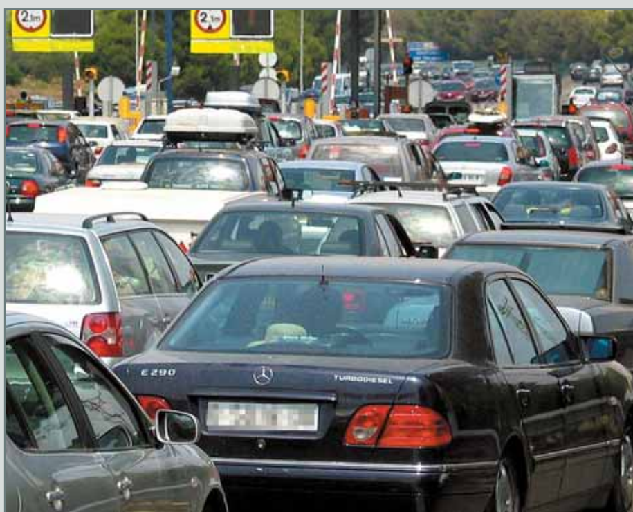
Los coches deberán circular a un máximo de 80 km/h en la primera corona del área metropolitana.

El área metropolitana de Barcelona registrará 1.200 muertes menos al año -un 4% de las defunciones por causa natural de personas de más de 30 años- tras la aplicación del plan de reducción de la contaminación que aprobó la Generalitat en julio. Así lo demuestra un estudio que presentó ayer el Centre de Recerca en Epidemiologia Ambiental (CREAL) , que también señala que las medidas que se aprobaron hace dos meses, como la reducción de la velocidad a 80 km/h en las carreteras, permitirán aumentar en cinco meses la esperanza de vida. El plan del Govern tiene como objetivo reducir hasta 40 microgramos por metro cúbico las partículas en suspensión inhalables en el horizonte del año 2010, para cumplir con el Protocolo de Kioto.