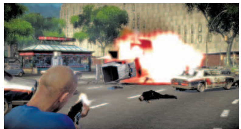
Imagen virtual de la Barcelona del videojuego The Wheelman

para ejercer la violencia, aunque sea virtualmente. En el vídeo promocional, sus creadores, Joe Neate, Simon Woodroffe y Shaun Himmerick, explican que la idea de inventar The Wheelman responde a sus ganas de mezclar las películas de persecuciones de coches de Hollywood y los videojuegos, y añaden que la estructura de Barcelona es la apropiada para que se desarrolle la acción.