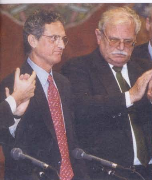
Dr. Luis Rojas-Marcos