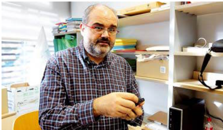
Fatjó posa en qüestió algunes tècniques dels programes de TV.

grans. El benefici fonamental és el de la companyia. Com més recerca es fa més es veu que el valor fonamental per a les persones és aquest. Saber que tens algú. Perquè amb l'animal formes un lligam afectiu. I és molt important en segons quins col·lectius, per exemple per a una persona gran. La fa més activa ni que sigui perquè ha de treure'l tres cops al dia! I fa que es relacioni amb altres persones. A vegades el gos és l'excusa.»